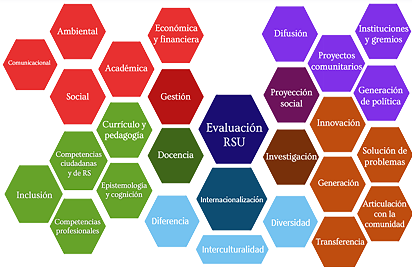
Figura 3 Dimensiones y factores de evaluación RSU

Las dimensiones y factores generales de evaluación que pueden incluirse en un instrumento de evaluación de la RSU se resumen en la figura 3.