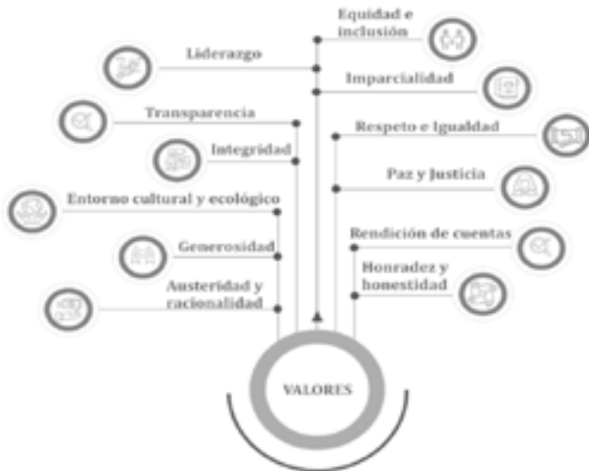
Figura 2 Valores institucionales