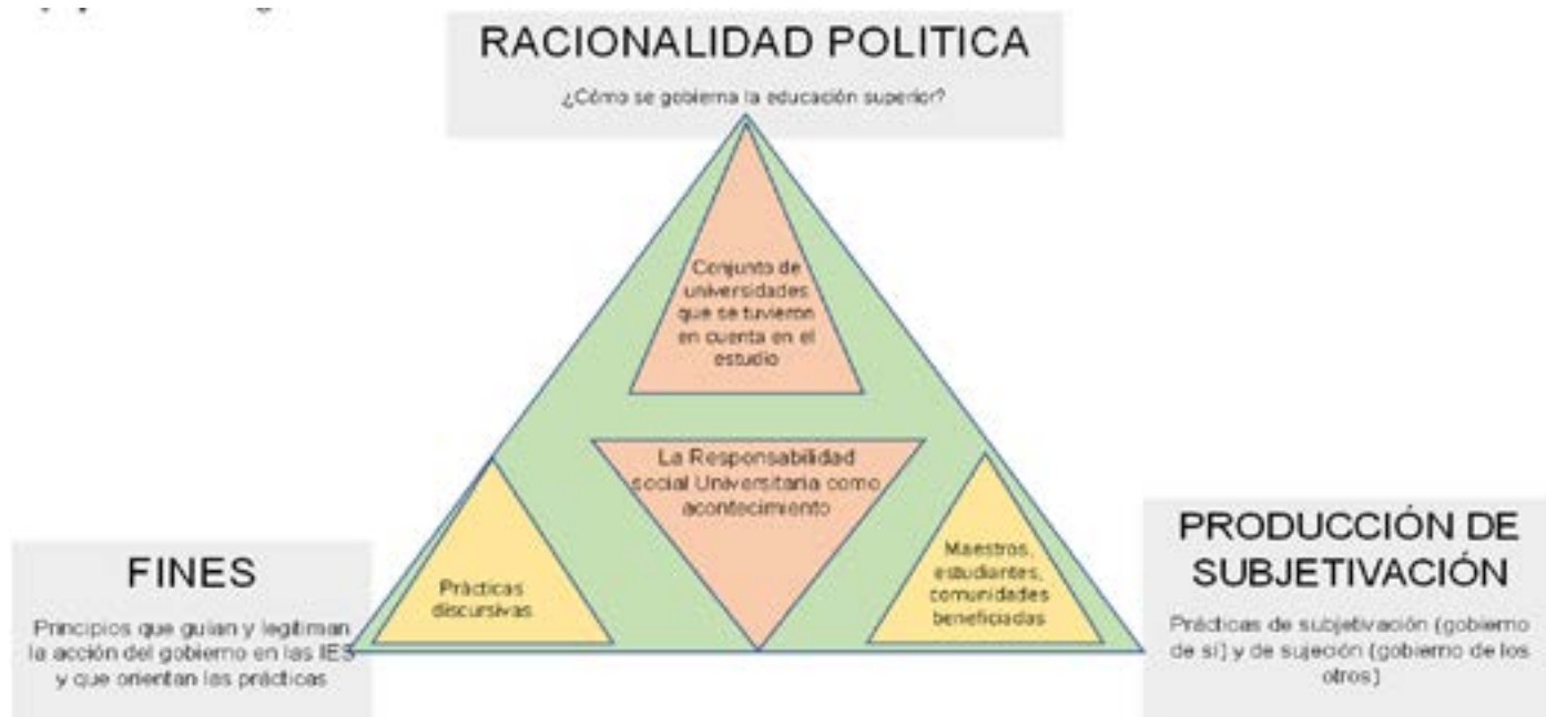
Figura 1 Enfoque Metodológico.

Nota: La figura explica el enfoque metodológico que se utilizó en el estudio centrado en los estudios de la gubernamentalidad, donde se aprecian los ejes de análisis centrados en la racionalidad política, los fines y la producción de subjetivación alrededor de las prácticas discursivas que se movilizan, las instituciones de educación superior y los sujetos implicados: maestros, estudiantes y comunidad. Adaptación de Cortés (2013, p. 31).