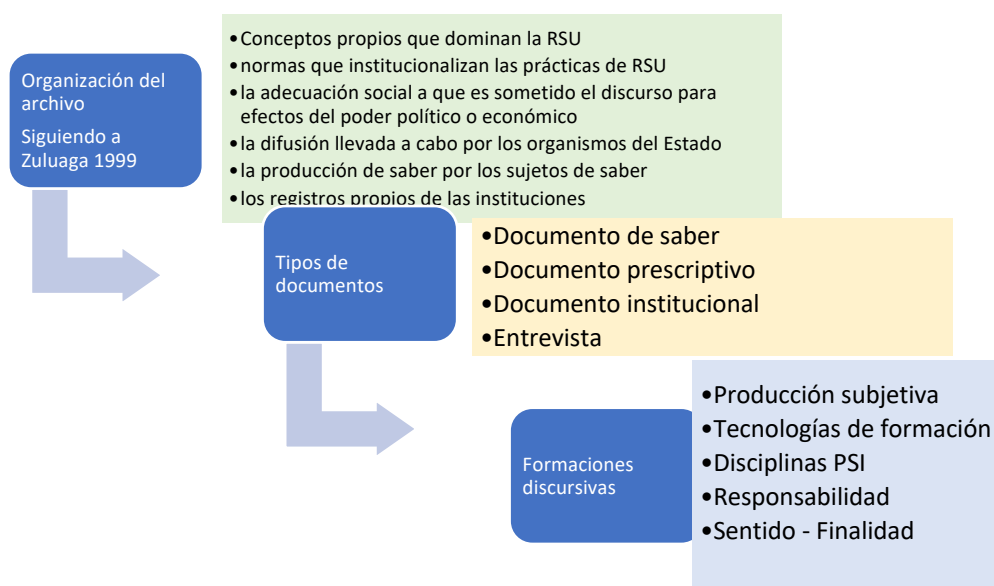
Figura 2 Proceso metodológico del análisis del archivo

Nota. La figura explica el proceso metodológico que llevó al análisis del archivo.